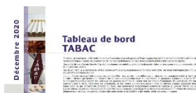
Tableau de bord tabac